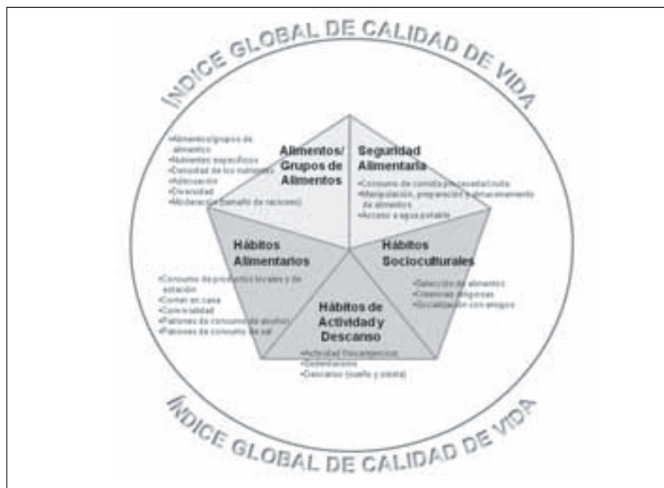
Fig. 2.— Índice global de calidad de la dieta. DQI: índice de calidad de la dieta, diet quality index; DQI r : índice revisado de calidad de la dieta, dietary quality index revised; HDI: indicador de dieta saludable, healthy diet indicator; HEI: índice de alimentación saludable, healthy eating index; AHEI: índice alternativo de alimentación saludable, alternative healthy eating index; MDS: puntuación de dieta mediterránea, Mediterranean diet score; Med-DQI: índice de calidad de dieta mediterránea, Mediterranean dietary quality index; MDS m : puntuación modificada de dieta mediterránea, Mediterranean diet score modified; MEDAS: cribado de adherencia a dieta mediterránea, Mediterranean diet adherence screener; MED-LIFE: índice de estilo de vida mediterráneo, Mediterranean lifestyle index and HI: índice de estilos de vida saludable, healthy lifestyle index.

CQI. Estos resultados ponen de manifiesto la importancia de la calidad y no solo de la cantidad o el porcentaje de la energía total de los hidratos de carbono de la dieta en el mantenimiento del peso corporal. En otro estudio en la misma cohorte, Zazpe et al. (2014) observaron que existía una estrecha correlación entre el CQI y la ingesta de 19 micronutrientes con relevancia en salud pública. La mejor adecuación en la ingesta de micronutrientes se observó en individuos con mayor CQI 49 .