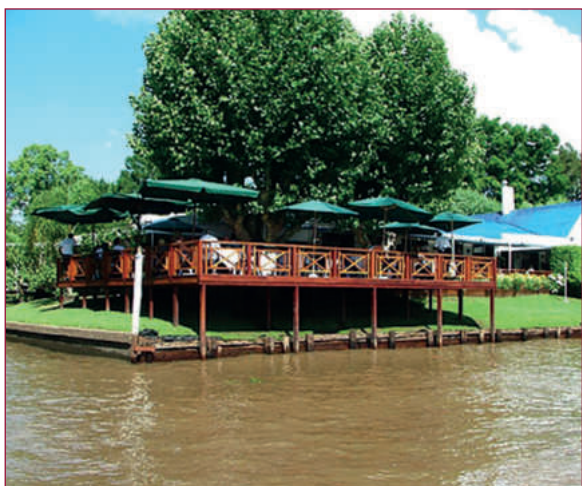
Fig. 3.—Delta del Río de La Plata.