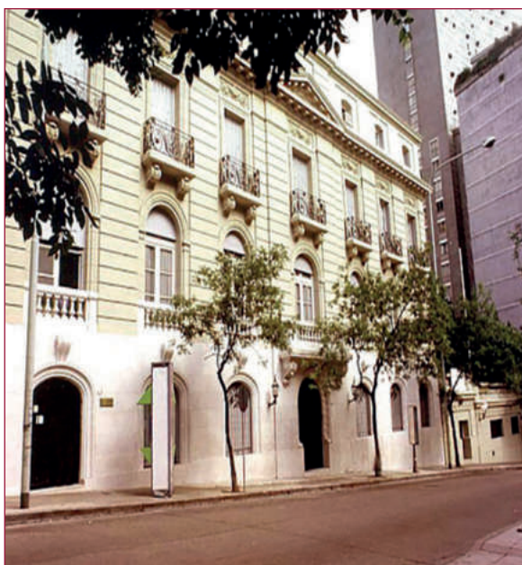
Fig. 2.—Yockey Club Argentino.

2) Yockey Club Argentino . Fundado el 15 de abril de 1882 por Carlos Pellegrini y un grupo de " caballeros representativos de la actividad política y económica del país ", siendo uno de los más tradicionales de Argentina,